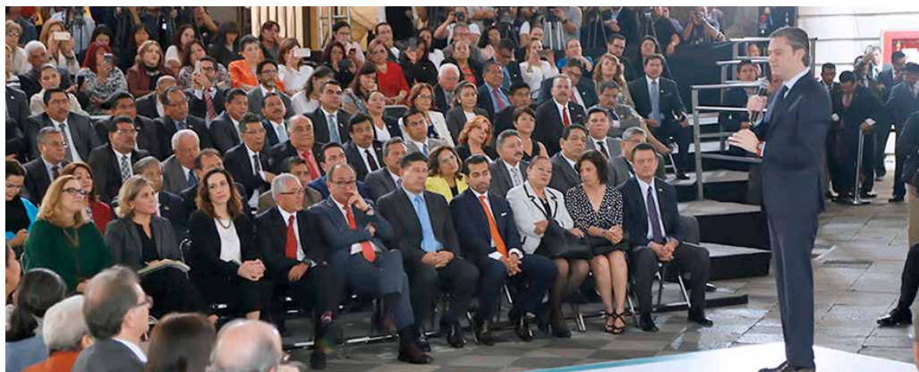
Presentación del Nuevo Modelo Educativo.

El segundo punto, dijo, es que los planes y programas buscan la educación integral, con énfasis en temas académicos, como el lenguaje, las matemáticas, el conocimiento del mundo natural y social, impulsando el desarrollo personal con la introducción de las habilidades socioemocionales, y el aprendizaje de la educación física y la educación artística.