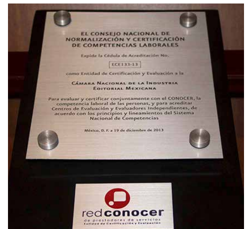
La red CONOCER reconoce a la CANIEM como Entidad de Certificación y Evaluación.

Recordamos a nuestros afiliados que la CANIEM cuenta con la facultad de redactar estándares de competencia que reúnen los conocimientos, habilidades y destrezas necesarias para cumplir una función a un alto nivel de desempeño, de acuerdo con lo definido en el estándar de competencia.