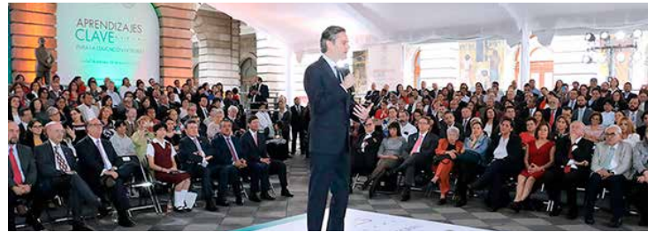
Aurelio Nuño, durante la presentación del Nuevo Modelo Educativo.

El funcionario señaló la necesidad de poner énfasis especial en los mexicanos más rezagados, con un cambio pedagógico que llegue a todos para