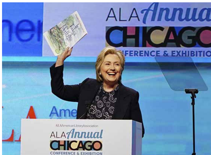
Hillary Clinton en su alocución en la Convención anual ALA 2017.

En 2016, Hillary Rodham Clinton se convirtió en la primera mujer en la historia de los Estados Unidos de Norteamérica en ser candidata del partido Demócrata a la Presidencia de los Estados Unidos. La carrera política de Hillary Clinton está basada en el servicio público que ha brindado a su país como Secretaria de Estado, Primera Dama, Senadora por el estado de Nueva York y como abogada.